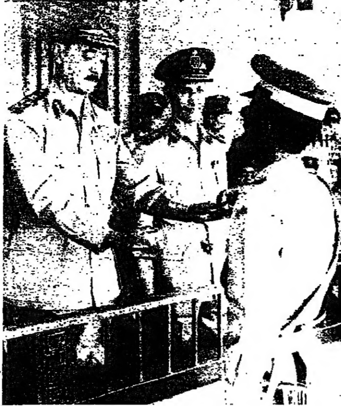
الفرق أول الجسي يسلم أجدال الضباط الخريجين شهادته

جلس مجلس الأمن الدولي الرئيس يوم الثلاثاء استقبل الوفود على حد سواء في جلسة علنية في مقر الأمم المتحدة في نيويورك. وفيما كان المجلس يدرس تقرير الأمين العام عن الشرق الأوسط، دعا المجلس بوجه السرعة لفسان وصول هذا القرار إلى الشرق الأوسط في أقرب وقت ممكن. وبتأييد هذا التصديق، وافق المجلس على اقتراح الأمين العام الذي يدعو إلى وقف إطلاق النار في الشرق الأوسط، وبتأييد هذا القرار، وافق المجلس على اقتراح الأمين العام الذي يدعو إلى وقف إطلاق النار في الشرق الأوسط، وبتأييد هذا القرار، وافق المجلس على اقتراح الأمين العام الذي يدعو إلى وقف إطلاق النار في الشرق الأوسط.